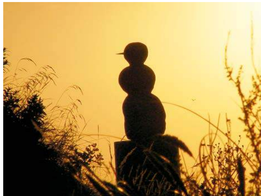
SNEMAND i solnedgang, 1997 Forsølvet bronze, 190×66×60 cm MONUMENT OG TRAPPE, Hirtshals