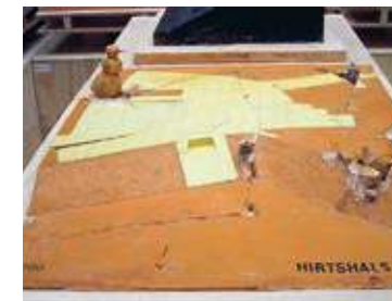
BYRÅDSPLASTIK, 1993 Model af DEN GRØNNE PLADS i Hirtshals