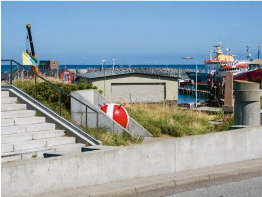
MINDESMÆRKER WWI og WWII Bemalet metal, granit og beton MONUMENT OG TRAPPE, Hirtshals

→ Monumentet SCOTT set fra det østlige trappeløb Forsølvet bronze, glasmosaik, træ og beton, 190 × 66 × 60 cm/200 × 120 cm MONUMENT OG TRAPPE, Hirtshals