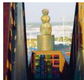
Monumentet SCOTT som bølge- bryder yderst på BASTIONEN

en særlig forbindelse mellem figurgruppen og den tids mennesker netop på det skæbneplan, der fysisk viser sig på Bastionens top – og mellem de to bølger. Det underlige ved dette skæbneplan er, at det til den ene side skiller bølgen og til den anden, at det vokser frem som et selvstændigt element – det synes, som om det er dette plan, hvor det daglige skærer det rituelle.