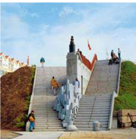
MONUMENT OG TRAPPE, 1997 Hirtshals

I tidernes morgen – under det sted, hvor Den grønne plads befinder sig – lå et stort trappeanlæg tilhørende en ukendt by, der strækker sig langt ind under det nuværende Hirtshals. Det er lykkedes at hæve, samle og dermed synliggøre de partier af trappeanlægget, der fortsat er intakte.