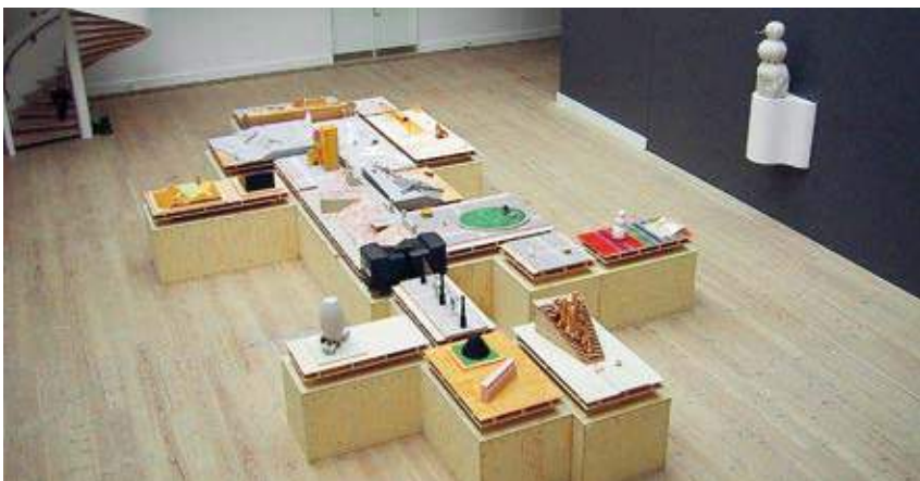
Installation af 42 m 2 skitser og modeller på Arkitektskolen Aarhus, 2001 Alle modeller tilhører KØS

Udstillingen belyser vores arbejde i Vendsyssel - dvs. i Hirtshals og Dronninglund. Gennem modeller, mockupper, tegninger, fotografier og fotostater samt forskelligt skriftligt materiale tegner vi et billede af den særlige æstetik og plastik, vi sammen har udviklet for værker i det offentlige rum under hensyntagen til det enkelte steds historie, topografi, skalaer, befolkning og de kommunale kunstneriske udvalg. Udstillingen viser eksempler på Gummigeometri - Byrådsplastik - Arkæoplastik - Sikkerhedsplastik - Kryptoplastik m.m. Man kan betragte udstillingen som et atlas over gennemførte og ikke-gennemførte projekter med byen, befolkningen og landskabet