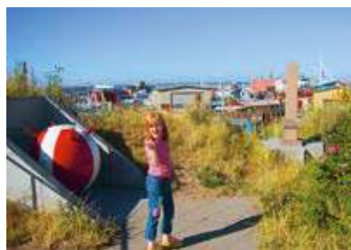
Nyplacering af MINDESMÆRKER fra WWI og WWII ved MONUMENT OG TRAPPE

Trappeanlæggets dele af granittrin samt dét, der nu kaldes Campidoglio-plateauet – Bastionen med Stalaktitloft og Skibsnavnesejlen – er samlet omkring en betonkonstruktion, der skal sikre det gamle anlægs nyrestaurerede dele.