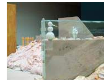
SIKKERHEDSPLASTIK på BASTIONEN, 1997 Model af rækværk til MONUMENT OG TRAPPE i Hirtshals