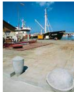
ARCAEO BASIS på kajen nedenfor MONUMENT OG TRAPPE med fragmenter af skulpturer