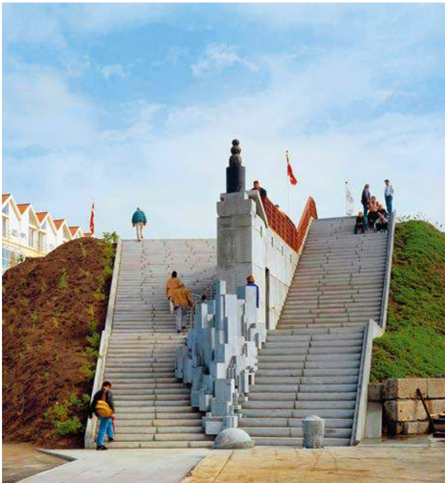
MONUMENT OG TRAPPE, 1997 Forsølvet bronze, glasmosaik, granit, beton, jord og træ, 10×15×16 m Udsmykning i samarbejde med Dorte Dahlin Hirtshals