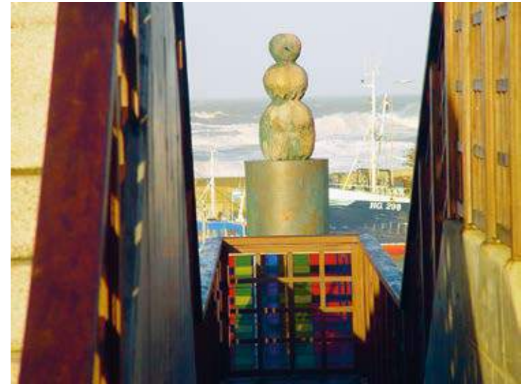
SCOTT yderst på BASTIONEN og SCOTT som bølgebryder, 1997 Forsølvet bronze, glasmosaik, træ og beton, 190×66×60 cm / 200×120 cm MONUMENT OG TRAPPE, Hirtshals