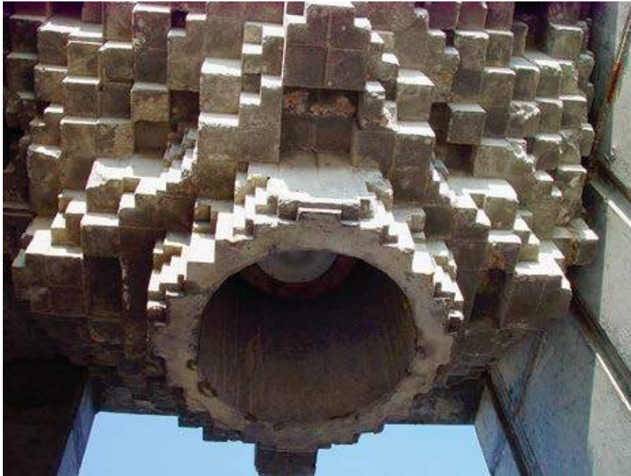
LYSEKRONE i passagen under BASTIONEN, 1997 Beton, 80×Ø 100 cm MONUMENT OG TRAPPE, Hirtshals