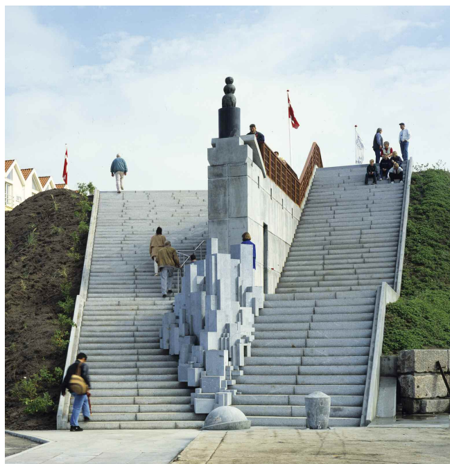
Monument og Trappe, 1997. Granit/beton/bronze. Hirtshals.

DD.: "Jo, men den enedes vi om at ændre, og fem måneder senere stod en plads, der både åbnede rummet og samlede lokalbefolkning og politikere, så der allerede i 1995 blev enighed om at realisere drømmen om en trappeforbindelse mellem by og havn, der blev til Monument & Trappe . Plads - og trappeanlægget bygger på stedets egen fortælling. Jeg - og vi - har synliggjort byens vilkår og som "Arkæo-agenter" bevaret historiske spor, som det hårde liv ved Nordsøen byder på, bl.a. sym-